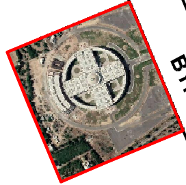
NEW HIGH COURT BUILDING