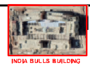
INDIA BULLS BUILDING